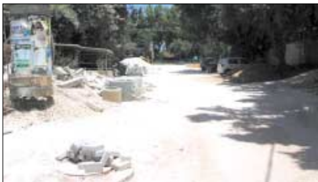
עבודות פיתוח ברחובות ויתקין ומשה הם בשכונת נווה מגן

פרויקט פיתוח ותשתיות רחב היקף בעלות כ-12 מיליון ש"ח