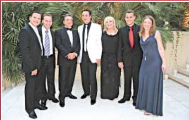
צילום: יח"צ / משפחת גינדי בהרכב מלא