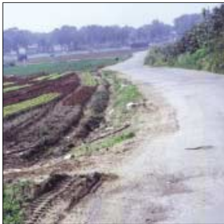
צילום ארכיון דרך השרף. עתיד סואן

השינוי הצפוי במספר כלי הרכב בשעת העומס, הינו הגורם העיקרי לעלייה הגבוהה הצפויה במפלסי הרעש גם לאחר שיוקמו במקום קירות אקוסטיים וכן הגורם העיקרי לעלייה במפלס זיהום האוויר, זאת על פי חוות הדעת הסביבתית הנוגעת לסלילתו העתידית של הכביש החדש בדרך השרף, אותה ערכה חברת אקו - הנדסה סביבה ואקוסטיקה עבור וועד תושבי דרך השרף.