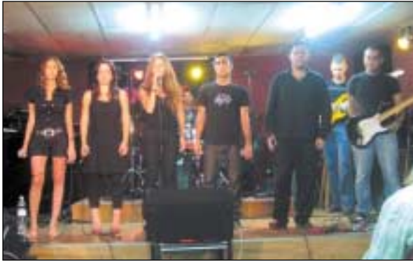
טקס סיום פרויקט "תו המשווה" ברמת השרון