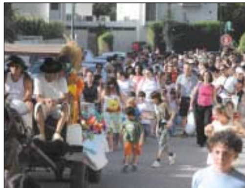
הג השבועות תעשה לך