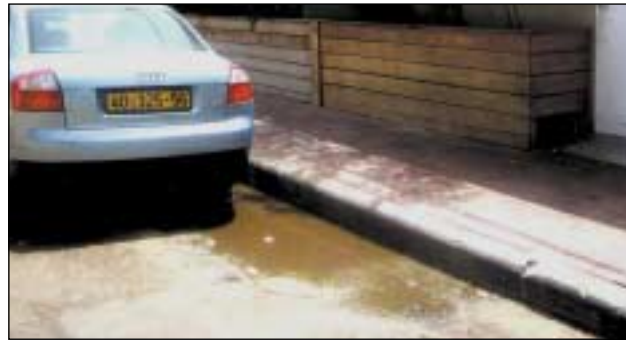
מקורה מים מאחורי המסעדה. "אין כל בסיס לטענות"